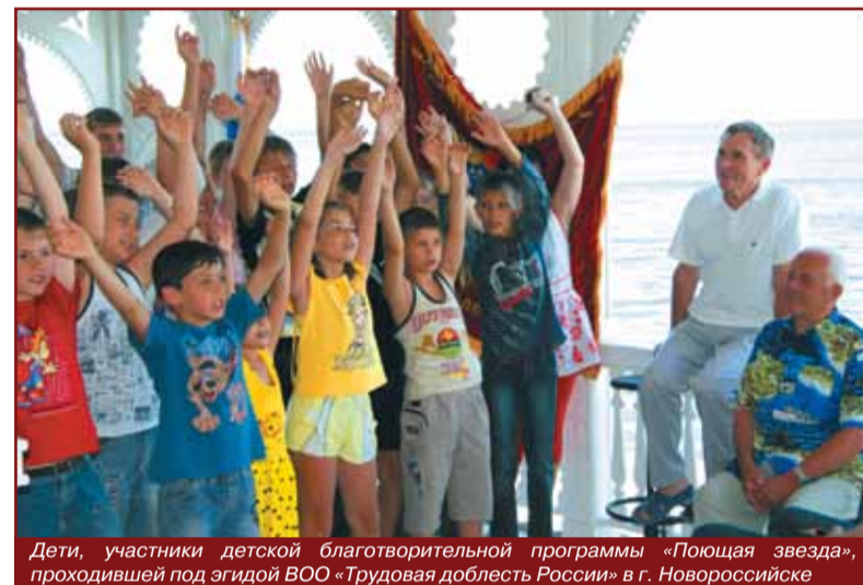
Дети, участники детской благотворительной программы «Поющая звезда», проходившей под эгидой ВОО «Трудовая доблесть России» в г. Новороссийске