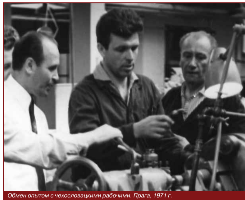
Обмен опытом с чехословацкими рабочими. Прага, 1971 г.

изучил деятельность всех 10 своих предшественников, использовал их лучший опыт, подобрал заместителей, привлек единомышленников и друзей. И, как говорится, «процесс пошел»! Мы понимали, что успех учебного заведения только в слаженной работе всего коллектива.