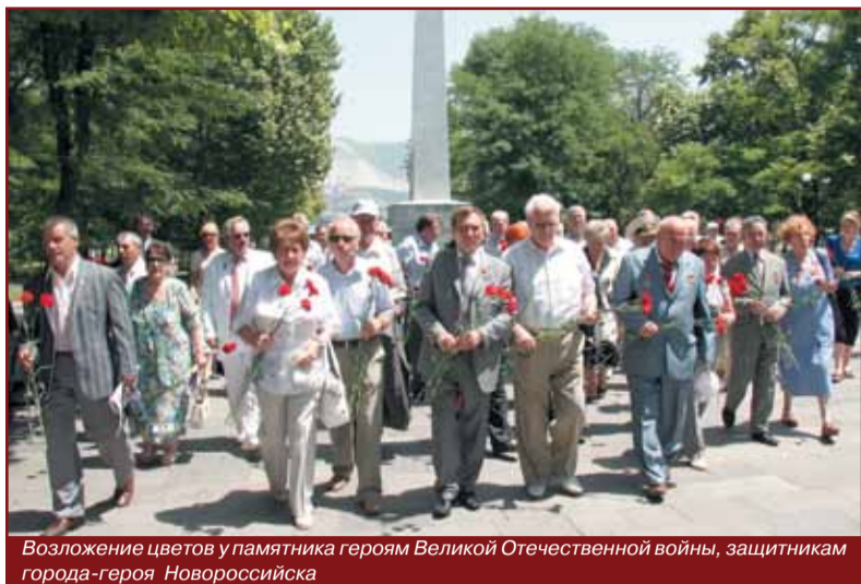
Возложение цветов у памятника героям Великой Отечественной войны, защитникам города-героя Новороссийска