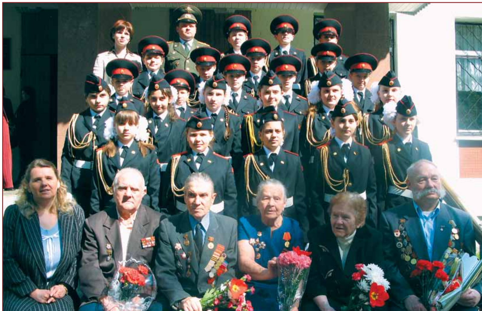
Преемственность поколений: будущие офицеры, учащиеся ГОУ «Кадетская школа № 1778 «Московский Шереметьевский кадетский корпус» на встрече с ветеранами