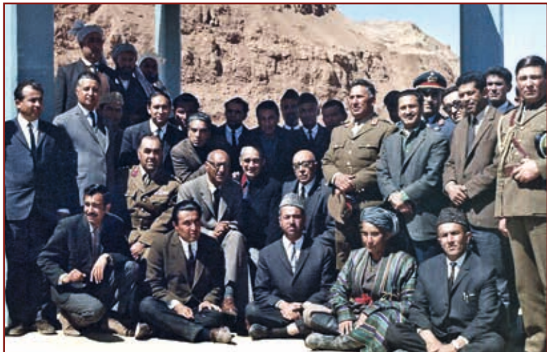
Строители и Король Афганистана Мухаммед Захир Шах (в центре) на строительстве 400-км трассы Пули-Хумри–Мазари–Шариф–Шибберган