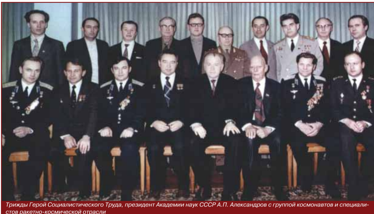
Трижды Герой Социалистического Труда, президент Академии наук СССР А.П. Александров с группой космонавтов и специалистов ракетно-космической отрасли

К началу 1965 г. появились признаки отставания по боевым ракетным комплексам, народно-хозяйственным задачам и исследованиям космоса. Министерству общего машиностроения было предоставлено право подключать к работам любое другое министерство, любой госкомитет для ликвидации наметившегося отставания. Плотно работая в тесном сотрудничестве с Министерством обороны, Академией наук и другими смежниками, было ликвидировано отставание, а затем мы даже обогнали американцев по большинству показателей. Результатом было