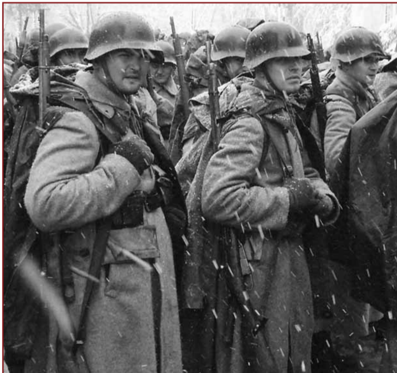
Приближалась зима и враг был уже под Москвой... Бойцам Красной Армии срочно требовались теплая шинель, белье, одежда... И купавинцы эти вещи фронту дали! (на фото: военно-исторический клуб «РКА», г. Санкт-Петербург)