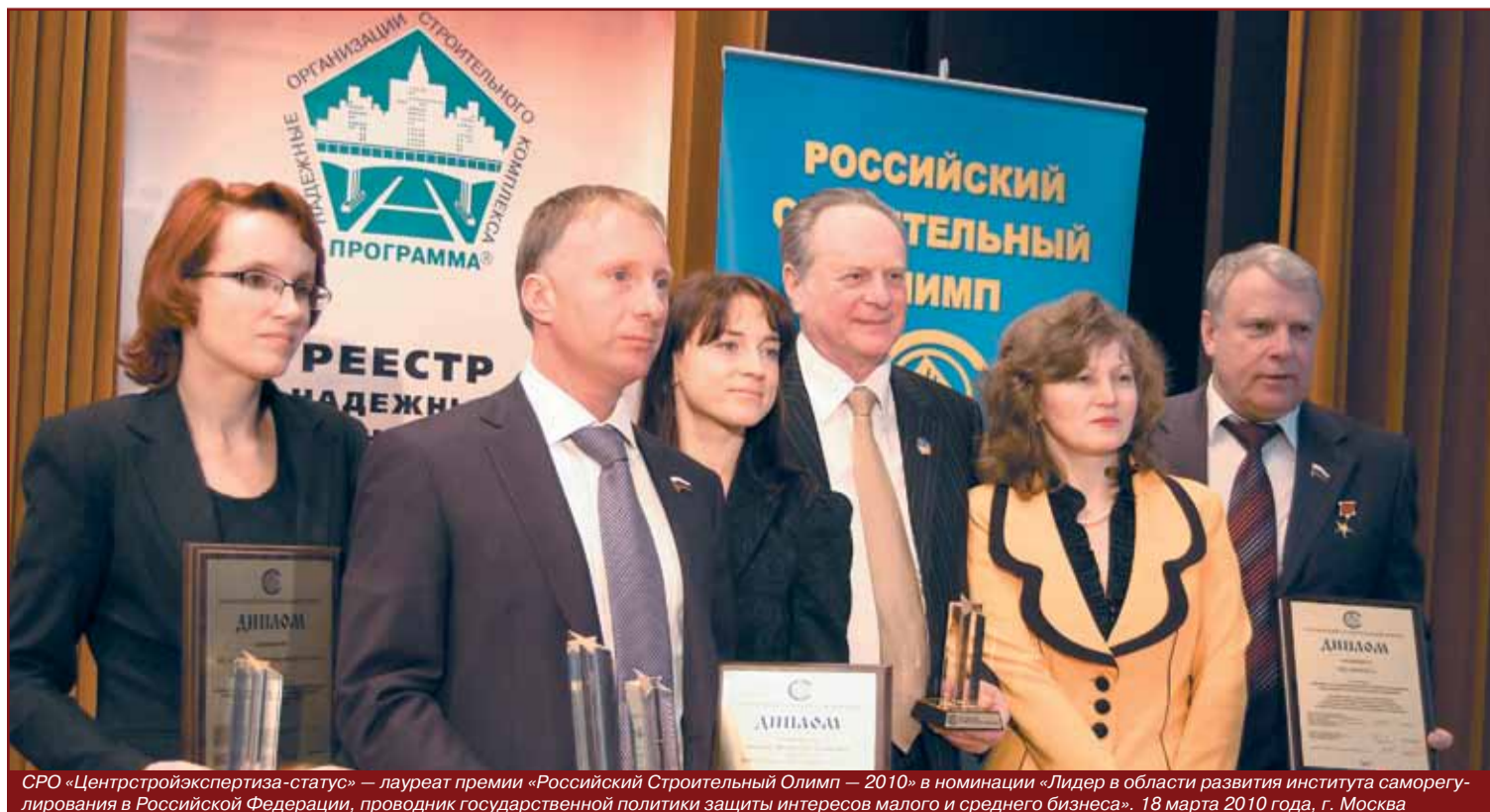
СРО «Центрстройэкспертиза-статус» — лауреат премии «Российский Строительный Олимп — 2010» в номинации «Лидер в области развития института саморегулирования в Российской Федерации, проводник государственной политики защиты интересов малого и среднего бизнеса». 18 марта 2010 года, г. Москва

Оргкомитет конкурса предоставил нашей организации полномочия Регионального представителя Оргкомитета по Москве и Московской области. Уверен, что проведение конкурса станет определенным вкладом в возрождение лучших профессиональных традиций строительной отрасли.