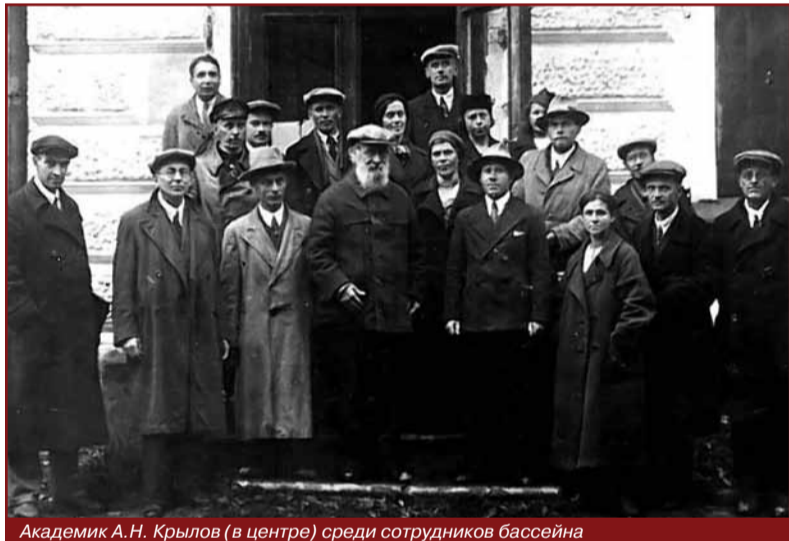
Академик А.Н. Крылов (в центре) среди сотрудников бассейна

Незадолго до смерти Н.Н. Бурденко выступил со статьей в газете «Красная звезда», в которой подвел итоги самоотверженного труда медицинских работников в годы Великой Отечественной войны. Он писал: «В результате проведения целого комплекса научно разработанных мероприятий советской медицине удалось спасти от гибели многие тысячи раненых и вернуть их в строй