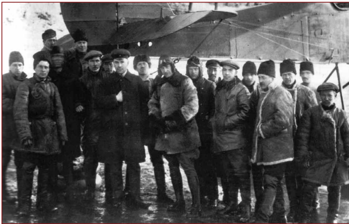
Первопроходец отечественного самолетостроения Н.Н. Поликарпов (заложил руку за борт пальто) на испытании истребителя

Всего в довоенный период Героями Социалистического Труда стали десять конструкторов и ака-