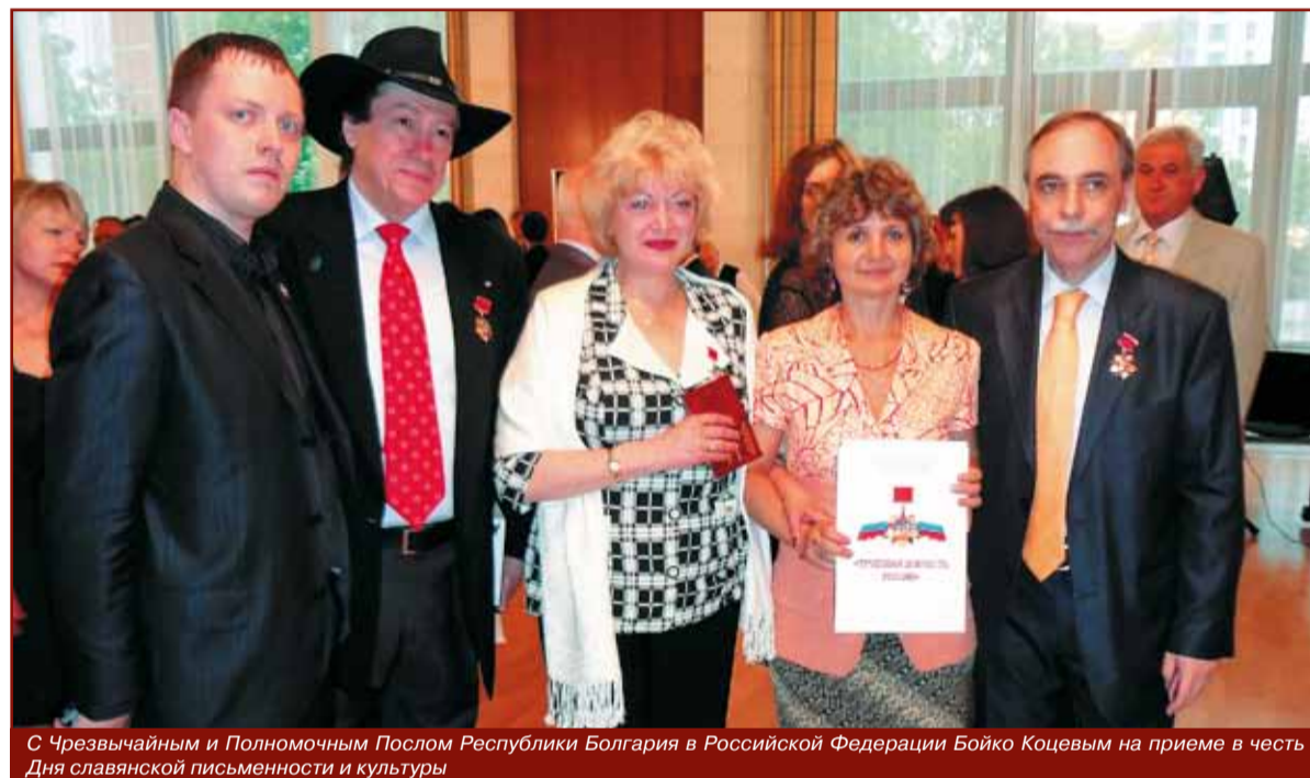
С Чрезвычайным и Полномочным Послом Республики Болгария в Российской Федерации Бойко Коцевым на приеме в честь Дня славянской письменности и культуры

22 мая в посольстве Болгарии в Москве состоялся торжественный прием по случаю Дней славянской письменности и культуры. Торжественным моментом встречи явилась церемония вручения наград ВОО «Трудовая доблесть России» наиболее выдающимся деятелям Болгарии. Это заслуженный певец и композитор, посол доброй воли Бисер Киров,